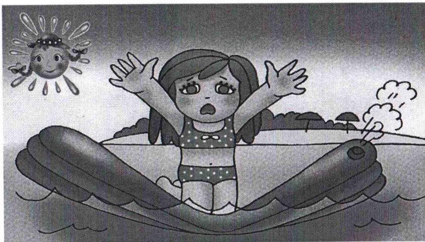
«Безопасность на воде для детей»

Вода – опасная для людей стихия. Даже спокойная водная гладь, несмотря на кажущуюся безопасность, таит в себе угрозы. Причем неприятности обычно случаются не с теми детьми, которые не умеют плавать, поскольку они обычно не заходят в воду глубже, чем по пояс, а с тем, кто мнит себя отличными пловцами. Тема «Безопасность на воде для детей» направлена на обучение ребят правилам поведения и снижение количества несчастных случаев. Ребенок дошкольного и младшего школьного возраста всегда должен купаться под присмотром взрослых. Более взрослые дети подросткового возраста, если и идут сами к водоему, то должны плавать только в специально отведенных для этого местах с безопасным проверенным дном, при отсутствии глубоких ям, сильного течения, водоворотов или больших волн. Многие несчастные случаи происходят именно из-за купания в запрещенных местах.